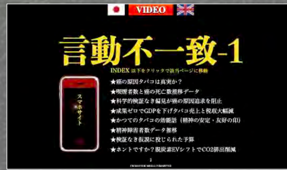
言動不一致日本語PC版