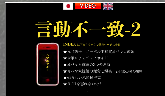
言動不一致日本語PC版