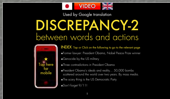
言動不一致英語PC版