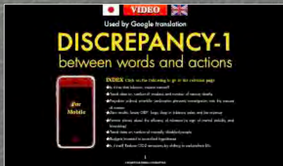
言動不一致英語PC版