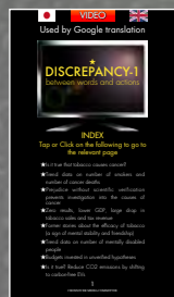
言動不一致 英語スマホ版