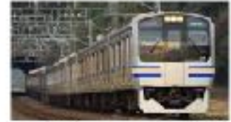
E217系 山陽新幹線 九州新幹線 E217系は、山陽新幹線と九州新幹線に運用されている高速列車である。