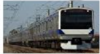
E531系 山陽新幹線 九州新幹線 E531系は、山陽新幹線と九州新幹線に運用されている高速列車である。