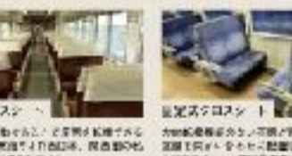
両向きクロスシート 両向きクロスシートの車内は、座席が向かい合っており、乗客が快適に過ごせる。

まだらの座席利用は、乗客が快適に過ごせるだけでなく、運転士も疲れにくいというメリットがある。また、クロスシートのみの列車は、都市近郊の日帰り旅で乗れるというメリットがある。