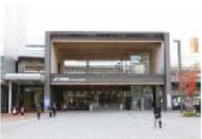
姫路駅の駅舎。現代建築の美しさと、歴史の重みを感じさせる。