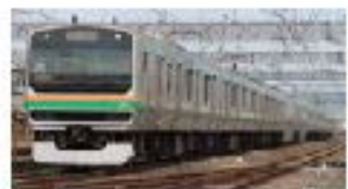
E231系 山陽新幹線 九州新幹線 E231系は、山陽新幹線と九州新幹線に運用されている高速列車である。

クロスシートのみの列車は、乗客が快適に過ごせるだけでなく、運転士も疲れにくいというメリットがある。また、クロスシートのみの列車は、都市近郊の日帰り旅で乗れるというメリットがある。首都圏エリアのクロスシート車は、相成両側に設置されることが多いが、クロスシートのみの列車も登場している。