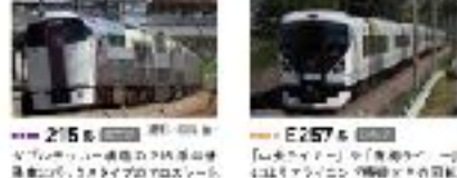
E257系 山陽新幹線 九州新幹線 E257系は、山陽新幹線と九州新幹線に運用されている高速列車である。