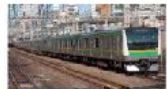
E233系 山陽新幹線 九州新幹線 E233系は、山陽新幹線と九州新幹線に運用されている高速列車である。