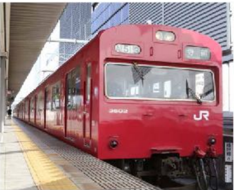
播但線「姫路線」の列車。赤い車体が目を引く。

また、姫路城の周囲には、多くの絶景スポットがある。姫路城の周囲には、多くの絶景スポットがある。姫路城の周囲には、多くの絶景スポットがある。姫路城の周囲には、多くの絶景スポットがある。