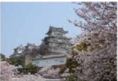
姫路城の天守閣。春には桜が咲き、絶景スポットの一つとして人気を集める。