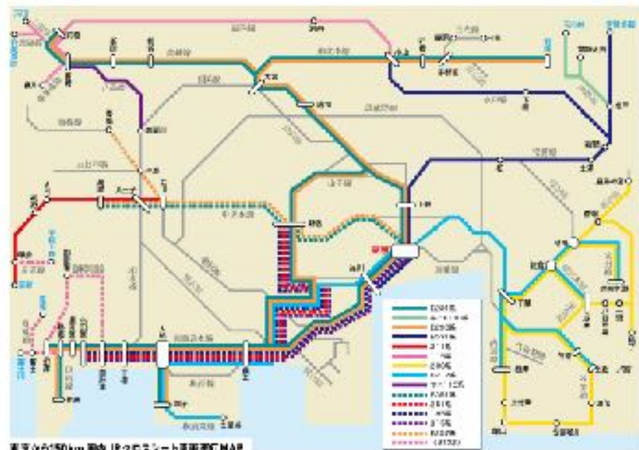
東京から150km 圏内JRクロスシート車両運行MAP

まだらの座席利用は、乗客が快適に過ごせるだけでなく、運転士も疲れにくいというメリットがある。また、クロスシートのみの列車は、都市近郊の日帰り旅で乗れるというメリットがある。