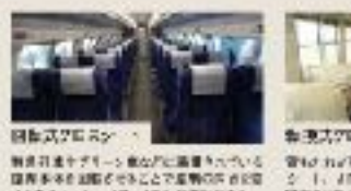
両向きクロスシート 両向きクロスシートの車内は、座席が向かい合っており、乗客が快適に過ごせる。